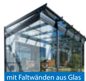
mit Faltwänden aus Glas