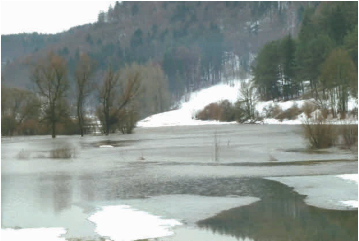
Hochwasser zwischen Traindorf und Veilbronn im Januar 2011